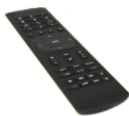
Diaľkové ovládanie 2x AAA batéria