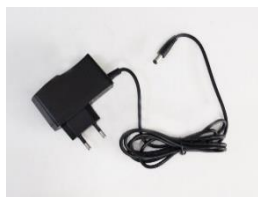
Zdroj, kábel na pripojenie do napájacej siete (230V)